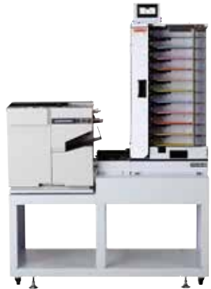
CISカメラ搭載 バーコードシートリーダー & 高速伝票仕分け機