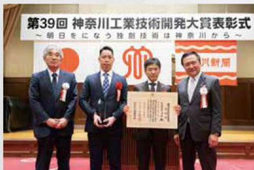
第39回神奈川工業技術開発大賞 表彰式の様子